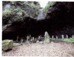
神奈川県指定史跡 土肥杉山巖窟

に頼朝がいたといつてゐるであり、実平が理由を聞いたといふことは、実平も一緒にいたといふことであり、いたといふことは、言い換えれば、敵の目を逃がっていたといふこととす。 吾妻鏡は頼朝が八十七年間に在る幕府の事跡を編纂し、日記体の記録であります。その吾妻鏡が、二十三日の石橋山の合戦、二十四日の堀口の合戦のち、頼朝主君は戦いながら土肥の山中、杉山に逃れ、あるいは巖窟に身を隠したと記しているわけでは、頼朝の隠れたところ「或る巖窟」は、一体どこにあるのでしようか。それは言うまでもありません。巖