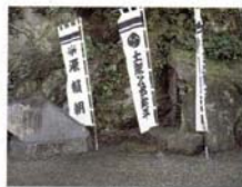
真鶴町にある石碑